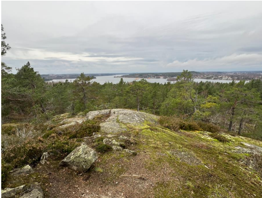
Figur 2. Från Vikingaberget har man en fin utsikt över Vårbyfjärden.

utsiktspunkten. Vikingaberget är del av landskapsparken vid Vårbergstoppen. Johannesdal ligger i ett dalstråk som mynnar ut mellan de branta höjderna vid Johannesdalsbadet. Området genomkorsas av belysta gångstigar och kan nås från söder via Vårbackavägen och från öster från Söderholmsskolan. Det föreslagna biotopskyddsområdet utgör en viktig målpunkt för närboende och elever från skolan.